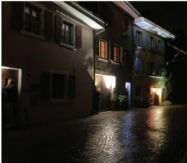
Exercice d'éclairage créatif lors de la promenade participative, l'automne passé.