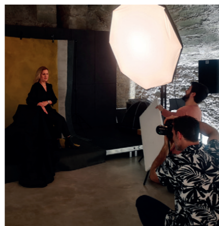
A gauche: l'affiche de l'exposition. Au centre: l'un des neuf grands portraits que le public découvrira dans les rues d'Avenches. A droite: une scène du shooting des Avenchoises dans le Caveau de l'Hôtel de Ville.